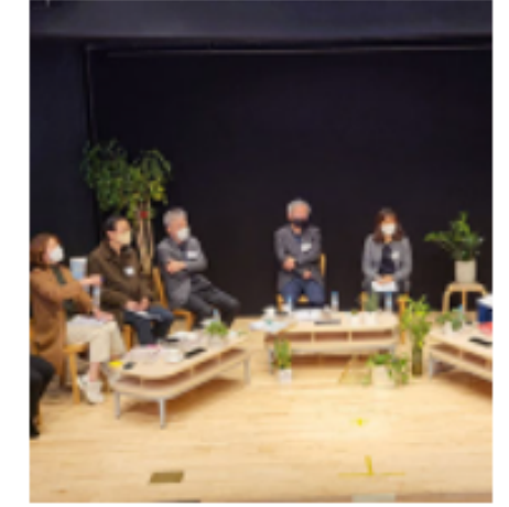
군포문화재단 #문화예술교육 #평생학습 #융복합 #지평순환 #공연