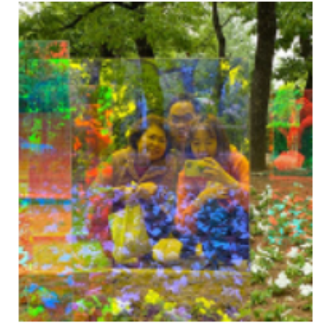
무모[MUMO] #공공미술 #경계없는미술 #문화예술교육 #시각예술 #조형물