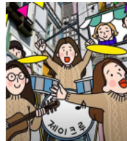
제이크루 음악커뮤니티 #음악교육, #음악치료 #통합예술교육 #문화예술교육 #경기.서울