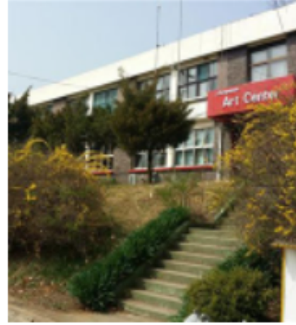
창문아트센터 #복합문화공간 #매교 #시각예술 #농촌체험 #자연미술학교

경기도 내 31개 시·군에서 활동하는 예술교육 단체·활동가·공간을 지역별로 만날 수 있습니다.