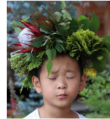
초록놀이터 #자연 #생태예술 #문화인성 #미술교육 #배워서남주기