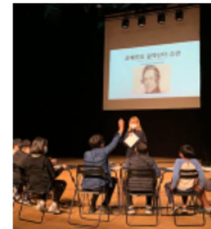
유러방 #극과 음악 #뮤지컬 #나의 삶 #보물찾기 #공연