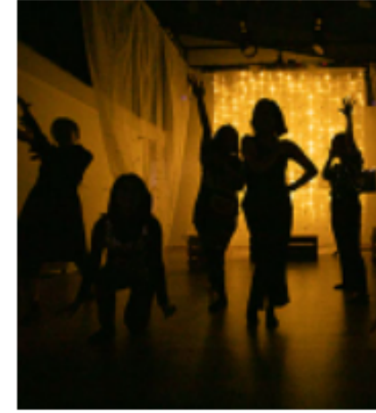
찾아가는 연희극단 너영나영 #연희극단 #커뮤니티씨어터 #통합예술 #실과예술 #양령