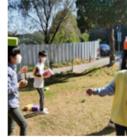
공간 옴팡 #공유공간 #당반곳 #사람들의연결과드러남 #준의동197번길 #임과편안함