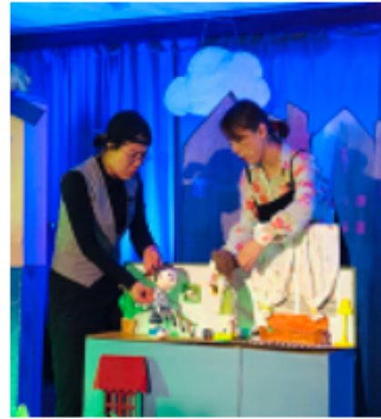
들락날락 예술가게 #생활문화 #통합예술 #지동마을극단 #예술치유 #공동체