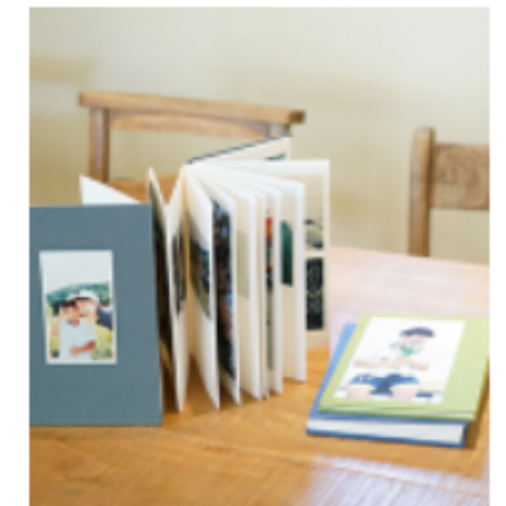
사월의 들판 #나의책 #사진 담점 #연극 #치유와 소통 #공동체